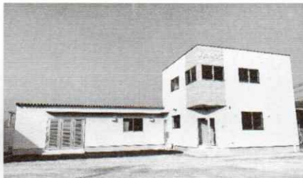
野菜パウダー製造工場