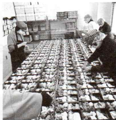
さくらランチのお弁当