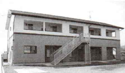
グループホームふぁみりあ砂田